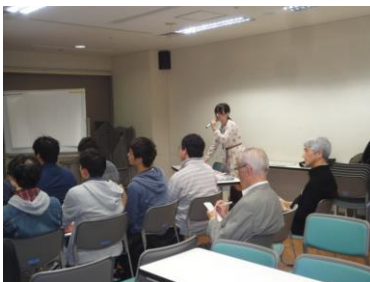
各大学の発表の様子