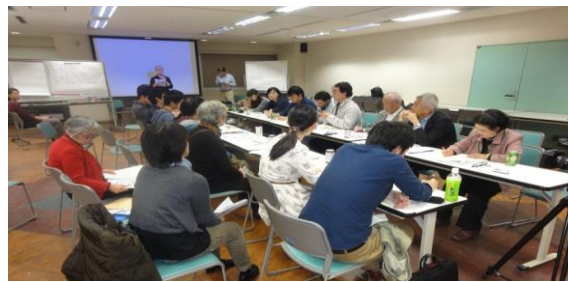
参加者全員で行ったディバートの様子